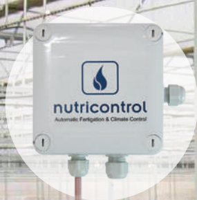
Sonda de Temperatura y Humedad No Ventilada