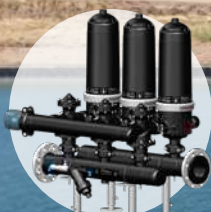
Batería de 3 Filtros Automáticos de 2"