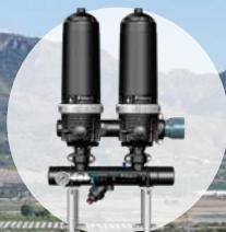
Batería de 2 Filtros Automáticos de 2"