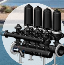
Batería de 4 Filtros Automáticos de 3"