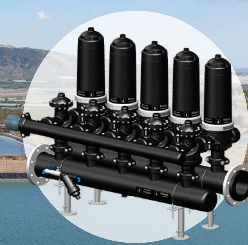
Batería de 5 Filtros Automáticos de 3"

Los filtros automáticos de anillas de Nutricontrol están fabricados en plástico técnico con colectores de polietileno de alta densidad (HDPE).