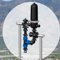
Filtro Automático de 2"

nutricontrol Automatic Fertigation & Climate Control